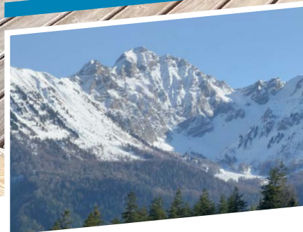
P18 - INSOLITE La traversée des anges