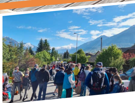
P9 - VIE COMMUNALE Vide grenier