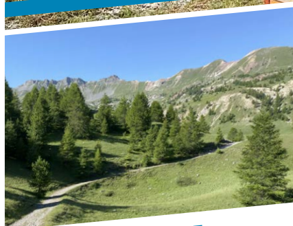
P8 - VIE COMMUNALE Péage de la route de la Melzeratte