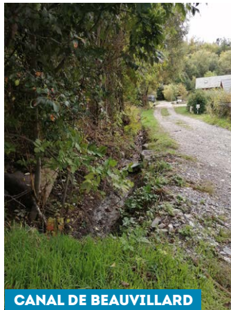
CANAL DE BEAUVILLARD