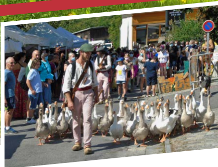
P6 - VIE COMMUNALE Les médiévales