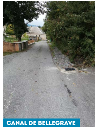
CANAL DE BELLEGRAVE