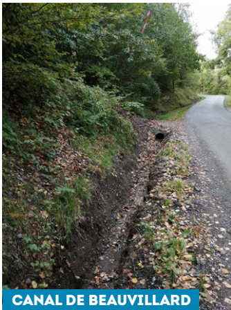
CANAL DE BEAUVILLARD

Cette année, ce sont les hameaux des Chaulières, de Marès, de Beauvillard et la route du Gîte de la Draye qui en ont bénéficié. A Beauvillard, le travail a été plus conséquent vu les inondations récurrentes subies par les riverains : des revers d'eau naturels ont été faits en amont, les canaux sont curés dans le hameau ainsi que le bord de route.