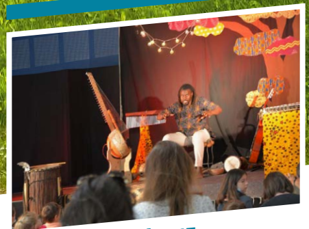
P14 - MÉDIATHÈQUE La Médiathèque en fête