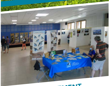
P12 - ENVIRONNEMENT Protection des espèces sauvages