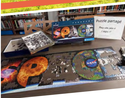
P4 - MÉDIATHÈQUE Le puzzle partagé