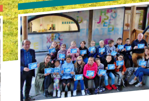
P6 - JEUNESSE Le livret de natation